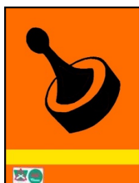
Bemandede routecontrole. Met oranje vlag.