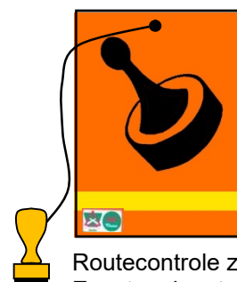
Routecontrole zelfstempelaar. Eventueel met oranje vlag.