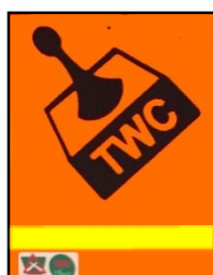
"Time Window" controle